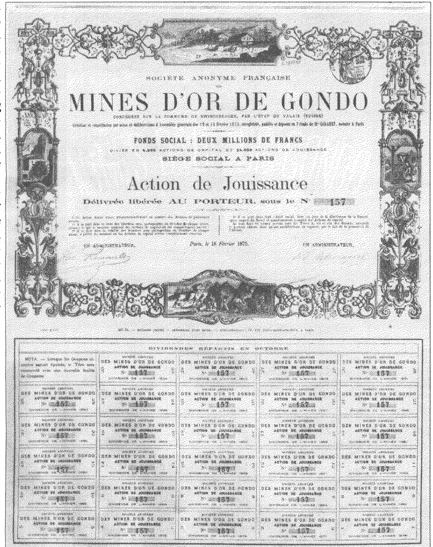
Schon die Römer sollen in Gondo das gelbe Metall abgebaut haben. Die «Société Anonyme Française des Mines d'Or de Gondo» wurde 1875 gegründet. Ein eigentlicher Goldrausch fand von 1893–1897 statt.